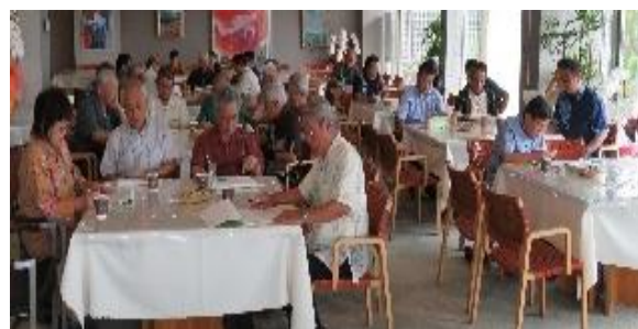
通常総会の全風景