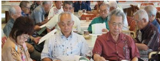
総会に参加の後援会員の皆さん