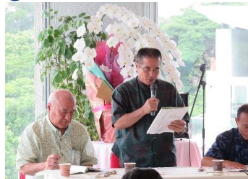
29年度活動報告をする屋比久副理事長