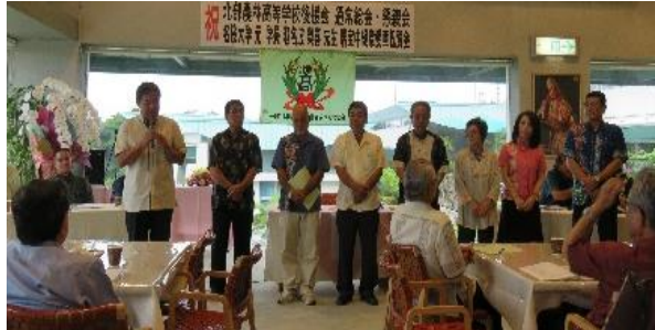
平成29年度から就任する新役員の方皆さん