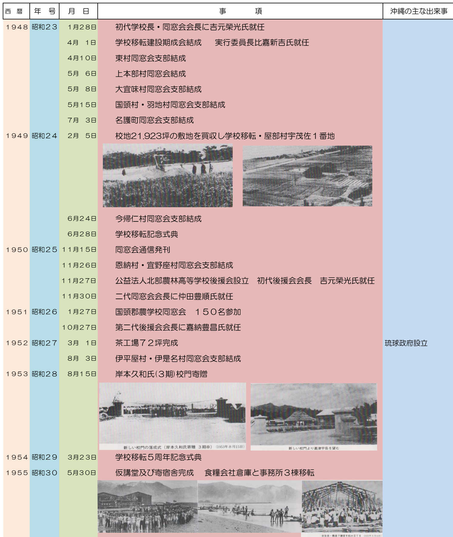
新しい校門の落成式(岸本久和氏寄贈 3期卒) (1953年8月15日)